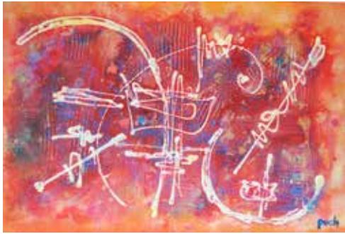
INSTRUMENTS DE L'ORCHESTRE Acrylique sur toile - 92 X 60 CM